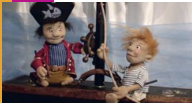
Theater con Cuore Mi. 20.06. 15 Uhr Käpt'n Sharky