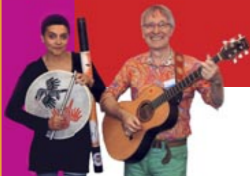
Haste Töne So. 10.06. 15 Uhr Karibuni - Weltmusik für Kinder